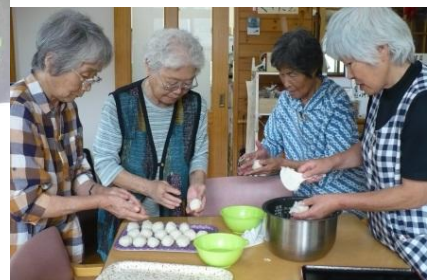
お彼岸のおはぎ作り 手慣れた手つきはさすがです。