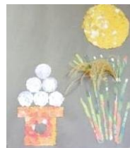
共同制作 (新聞のちぎり絵)