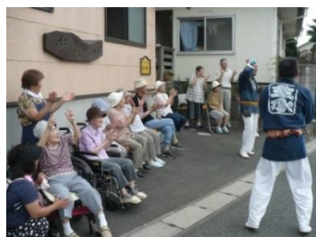
7 月 27 日 夏まつり みこしが虹の家にやってきた！