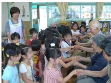
七夕飾りをもって保育園へ握手から伝わるパワーをもらって・・・