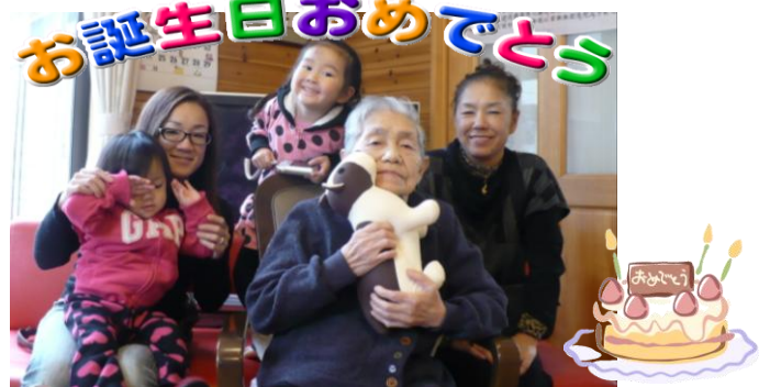
1月17日Mさんの87歳の誕生日会。娘、孫、ひ孫さんも参加してにぎやかでした。