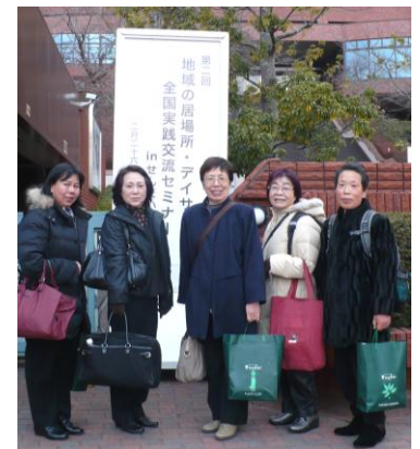
総勢5名で仙台へ—実践発表2題 (しっかり留守番をしてくれるスタッフがいてこそです。)