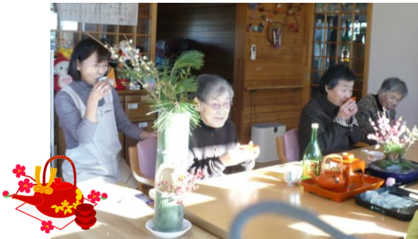
2011年初春、皆でおとそを飲んでお祝いしました。