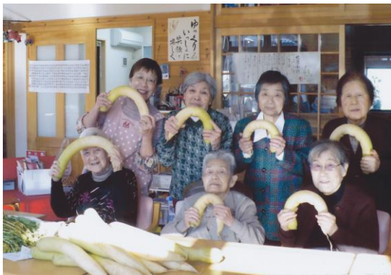
恒例の沢庵づけ 今年も30本漬け込み、皆でおいしくいただきました。