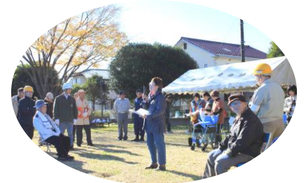
地域の皆さんに虹の家の説明

小規模多機能に移行して2年、8月より登録定員を22名から25名に増やして緊急の対応にも備える体制にしました。2ヶ月に一度の運営推進会議は自治会、民生委員、新木地区まちづくり協議会、湖北地区社協、市の介護支援課、地域包括支援センターの方々と一緒に集まるので、地域の問題など、その場でそれぞれの立場からの意見を集約できるという利点があります。このような積み重ねがあって12月4日新木野地区での防災訓練当日は、虹の家についての説明と万が一の時の手助けを地域住民の方々にお願ひしました。