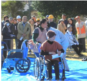
車椅子の取り扱いの説明

その時に車椅子の取り扱い方についても是非知ってほしいと車椅子操作の簡単な説明もさせていただき、防災訓練終了後、車椅子試乗体験会も行いました。